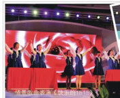
情景歌舞《致敬水人》