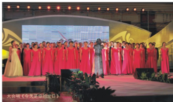
大合唱《今天属于我们》