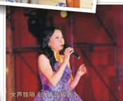
女声独唱《苏州水韵》