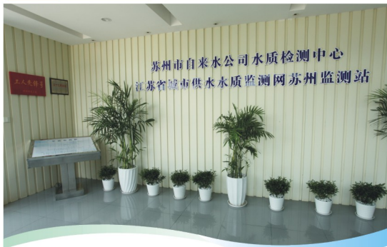
苏州市自来水公司水质检测中心 江苏省城市供水水质监测网苏州监测站