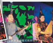
古筝演奏《南水北调》