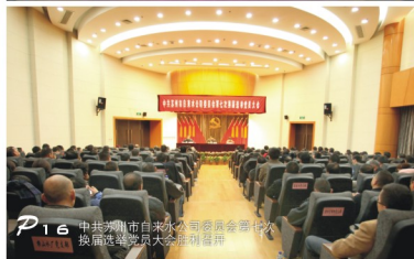
P16 中共苏州市自来水公司委员会第七次换届选举党员大会胜利召开