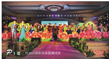
P12 供水60周年庆典圆满结束