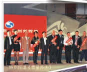
特别节目《致敬水人》