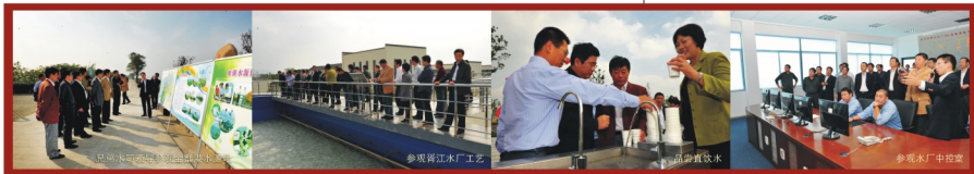
参加水司成立60周年暨金墅港水源地、胥江水厂