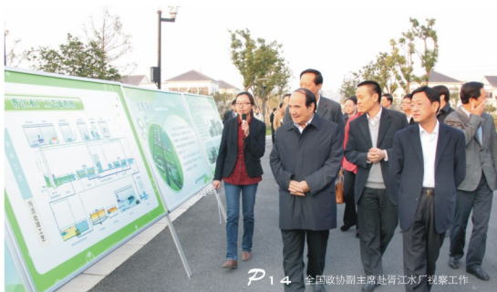
P14 全国政协副主席赴胥江水厂视察工作