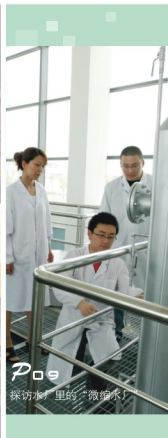
P09 探访水厂里的“微缩水厂”