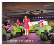
大型歌舞《水润姑苏》